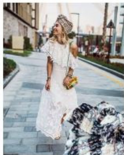
„Georgina Chanel“-Turban von Tribbe Hats by Blanka um € 150,-

Ein Turban in bunten Farben macht Lust auf Sommer und die nächste Reise in den Süden. Besonders süß sehen wallende Kleider dazu aus.