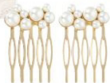
Haarkamm „Shimmer Pearl“ von Bijou Brigitte um € 7,95