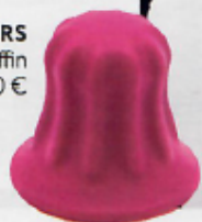
SHAPEWEAR FÜRS HAAR „Pony Puffin Original“, ca. 10 €

IHREM PFERDESCHWANZ FEHLT DER SCHWUNG? HIER HILFT DER „PONY PUFFIN“: DER KLEINE KEGEL AUS SILIKON WIRD MITTIG IN DEN ZOPF GESTECKT UND MIT DEM HAARGUMMI BEFESTIGT. SO KATAPULTIERT ER IHREN PONYTAIL IN UNGEÄHNLICHE HÖHEN.