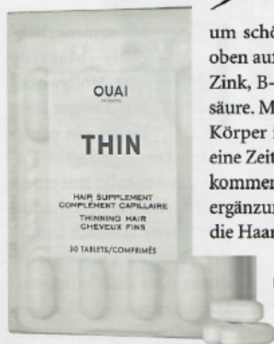
HAIR FOOD „Thinning Hair Supplement“: Ouai, 30 Kapseln ca. 30 €; net-a-porter.com

Was viele oft unterschätzen: Schwache Strähnen brauchen das richtige Futter, um schön und kräftig wachsen zu können. Ganz oben auf dem Happy-Hair-Menü stehen z. B. Biotin, Zink, B-Vitamine, Aminosäuren, Eisen und Kieselsäure. Mit einer ausgewogenen Ernährung erhält der Körper in der Regel genug davon. Wird's aber mal eine Zeit lang stressig, kann genau die schnell zu kurz kommen. Auf dünnes Haar spezialisierte Nahrungsergänzungsmittel können in diesem Fall helfen und die Haarfülle von innen unterstützen.