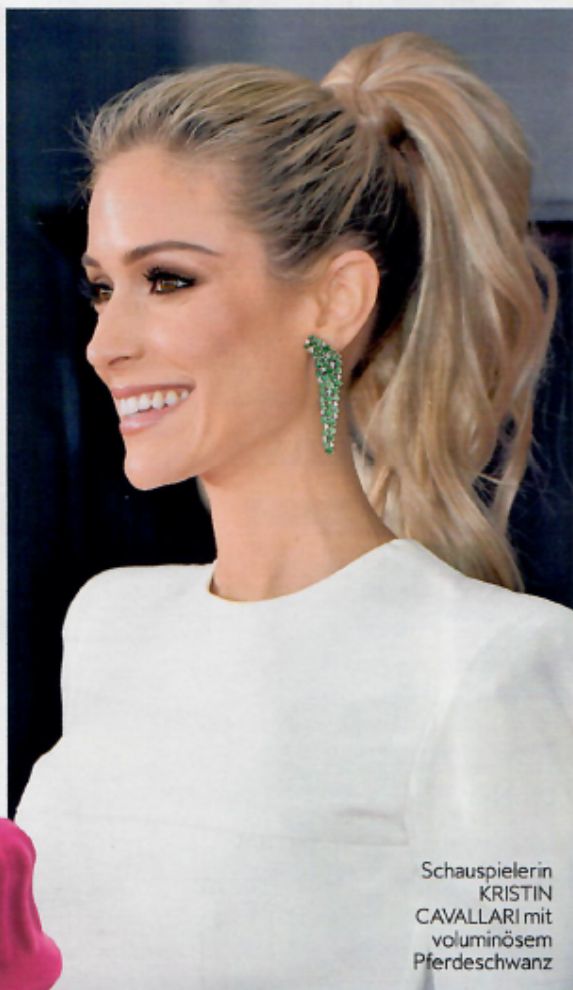
Schauspielerin KRISTIN CAVALLARI mit voluminösem Pferdeschwanz